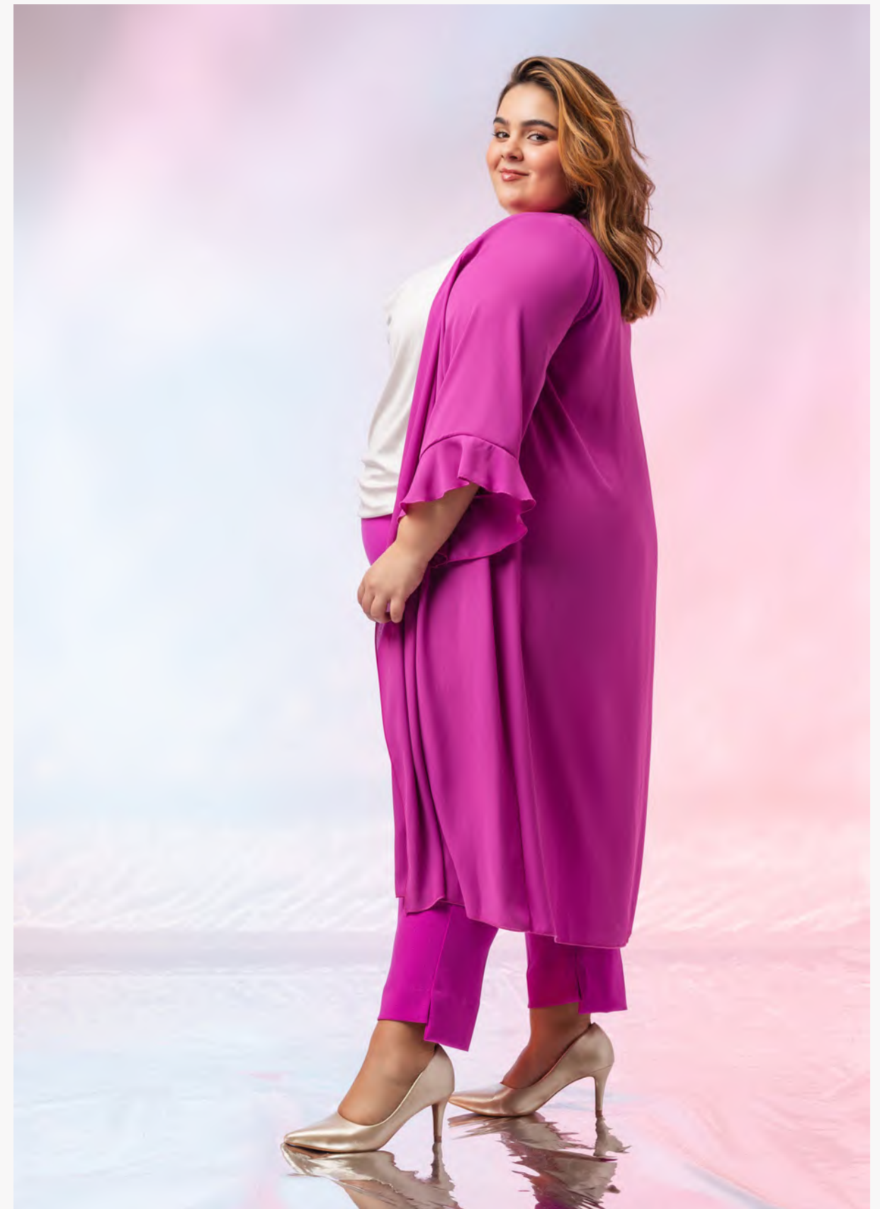
49. Casaco | ref. 248010 Casaco em tecido liso, com rachas laterais e manga 3/4 com folho.