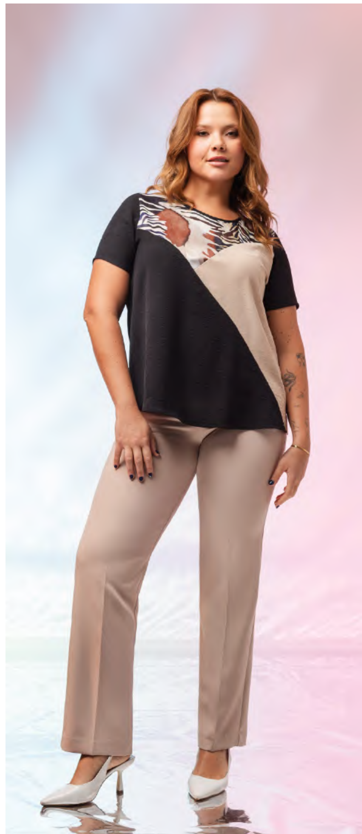
Túnica | ref. 251031

Túnica em tecido, manga curta e decote redondo