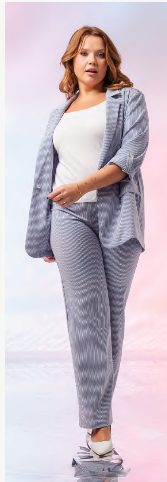
Blazer | ref. 258008

Vestido em malha lisa, com bolsos laterais, manga 3/4 e ombreiras.