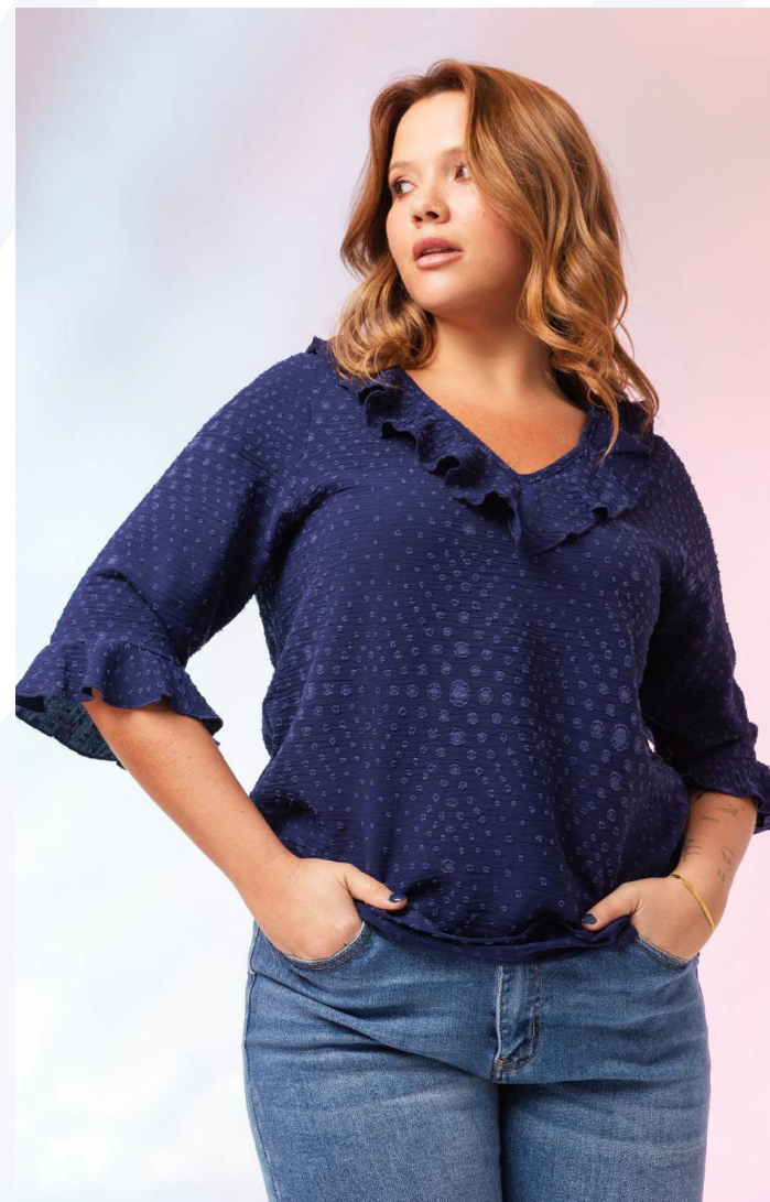
Túnica | ref. 251035

Túnica em tecido liso com relevo, decote em bico com folho e manga 3/4.