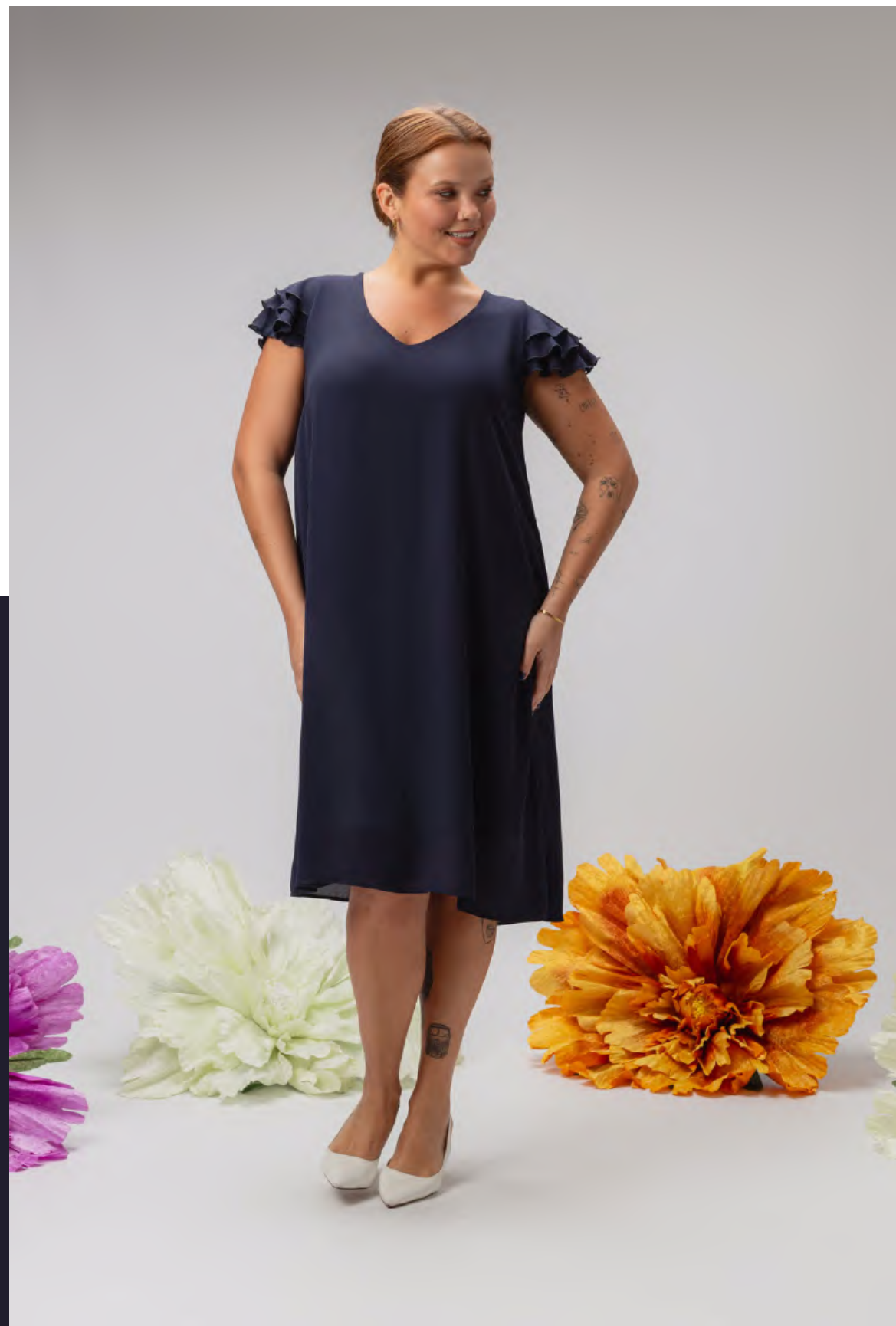
56. Vestido | ref. 246072 Vestido forrado, liso, em modelo evasé, com mangas com folhos.