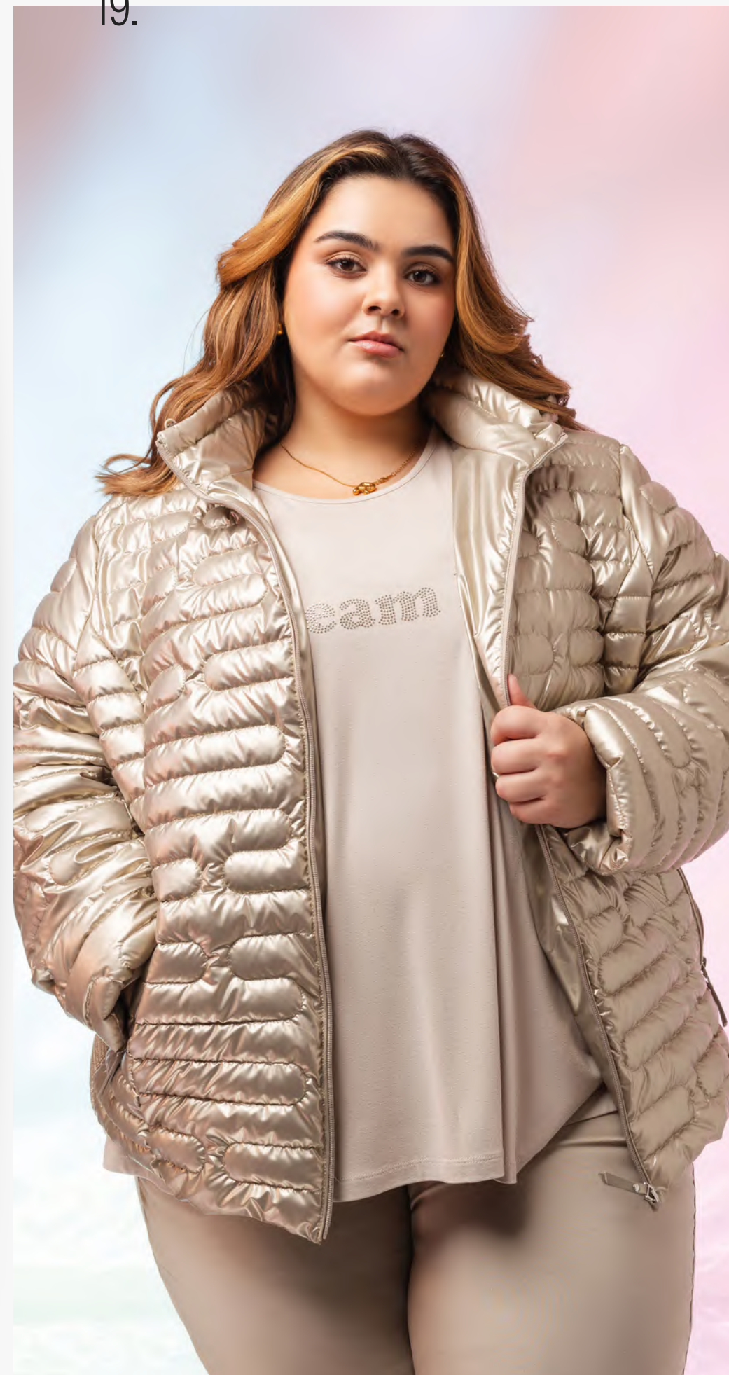
Parka | ref. M114JRT21

Parka em tecido liso com bolsos e capuz.