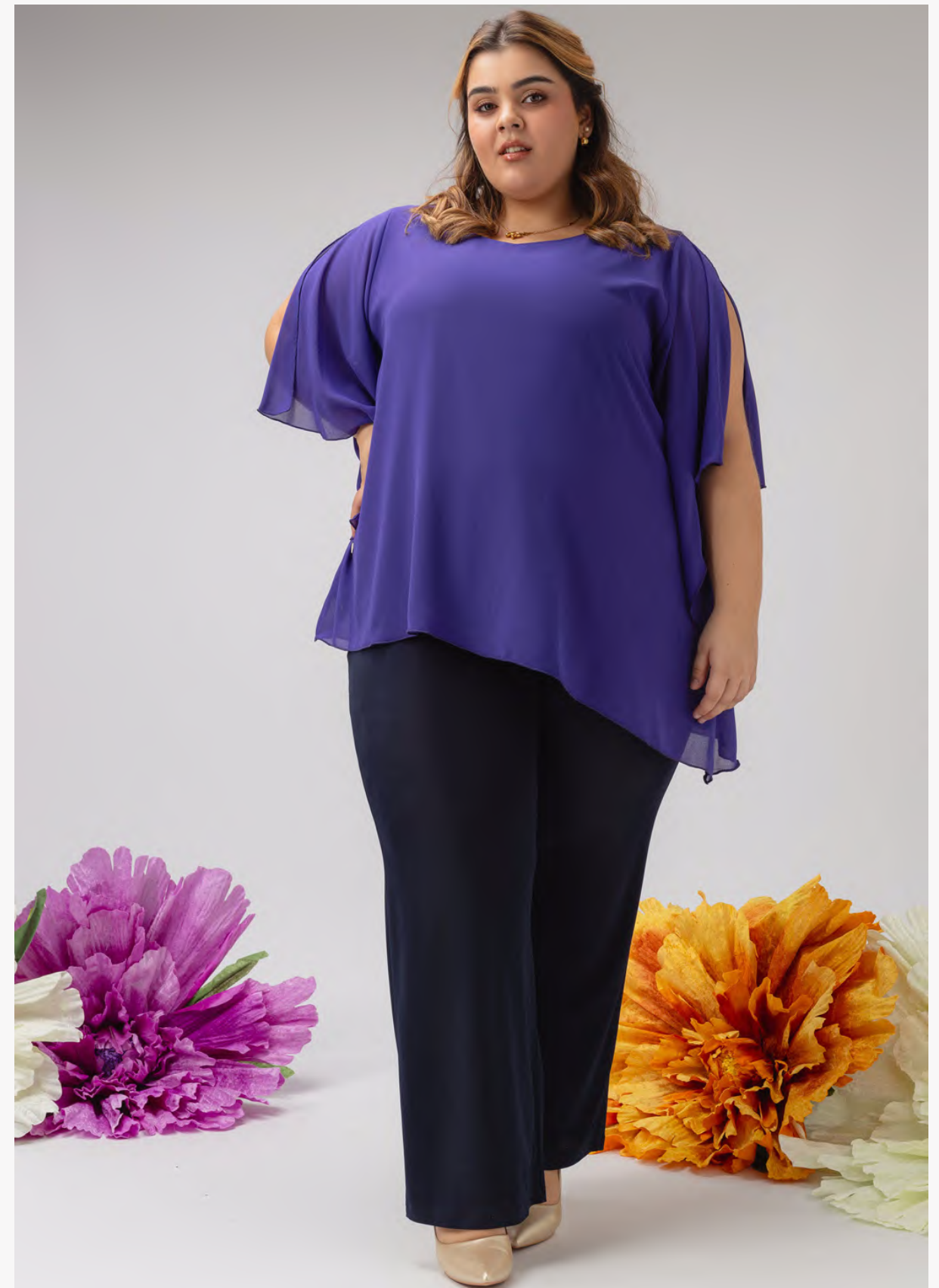
Calça | ref. 213006 Calça a direito em malha lisa, com elástico na cintura.