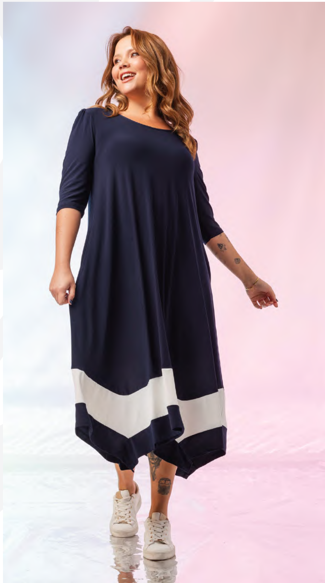
Vestido | ref. 256008

Vestido em malha lisa, com bolsos laterais, manga 3/4 e ombreiras.