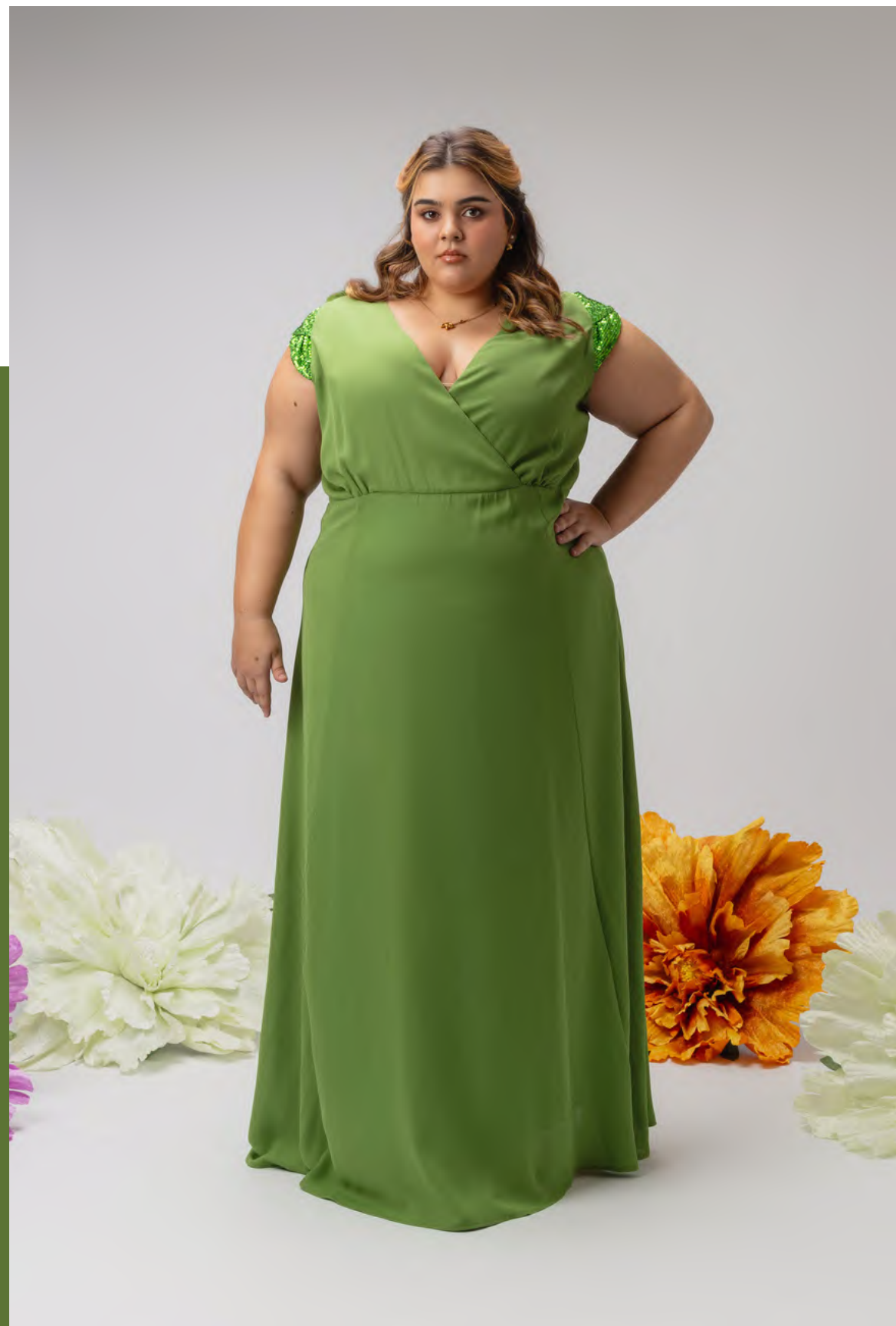
56. Vestido | ref. 246081 Vestido em tecido liso, com trespasse no decote e manga com lantejoulas.