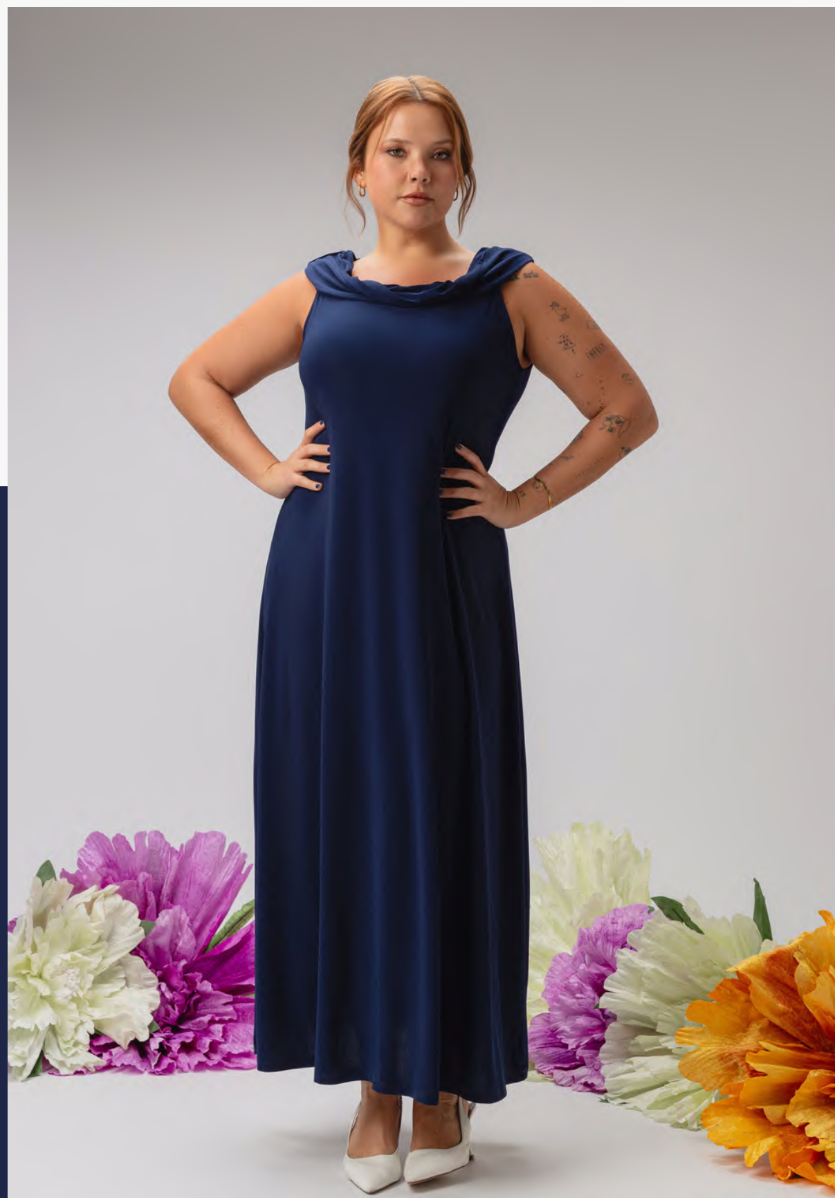
51. Vestido | ref. 256015 Vestido em malha lisa, modelo evasé.